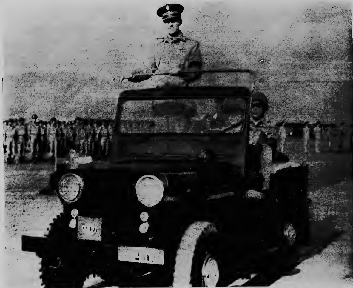
Riba e foto aki nos por mira Rey Constantino di Grecia inspeccionando e tropanan di ehército cu ta staciona den e parti central di supais. Siman pasa e Rey a baha su gobierno cu ayudo di ehército y nan a detene 500 comunista.

Sin embargo asunto dje encendio y demas investigacionnan pa evita un semehante catastrofe na un otro ocasion a exigitrobre masha hopi tempu y kizas tambe demoralizacion den participantenan dje vuelonnan.